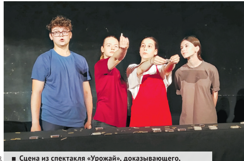
Сцена из спектакля «Урожай», доказывающего, что для истинного театра важен прежде всего способ существования исполнителя на сцене